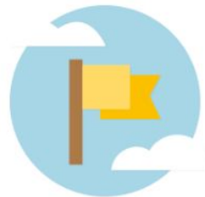
Figure locale ou publique

Connectez-vous et partagez avec les personnes de votre entreprise, de votre équipe, de votre groupe, de votre club ou tout simplement autour de vous.